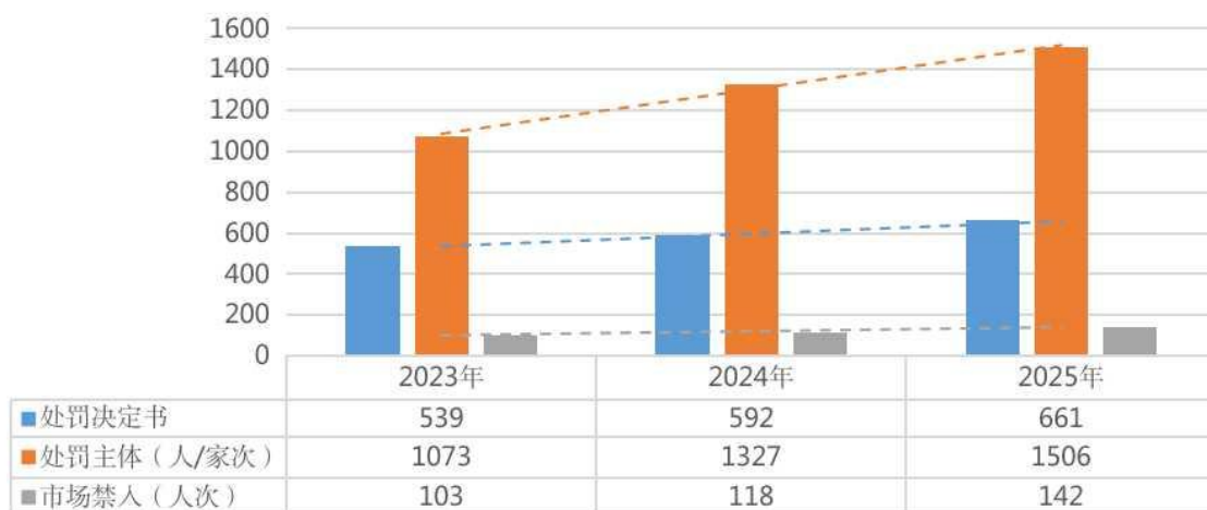
近三年中国证监会行政处罚情况